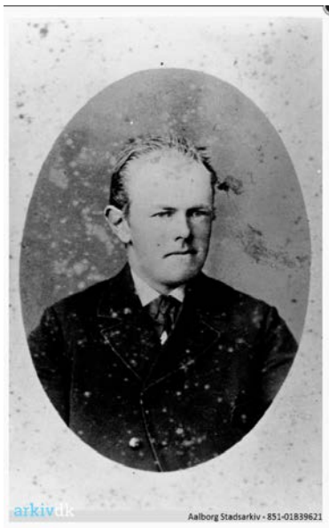
Jørgen Christian Jørgensen S.Hestvang, arkiv.dk 1886