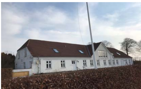
Hovedbygningen til S.Hestvang opført 1860